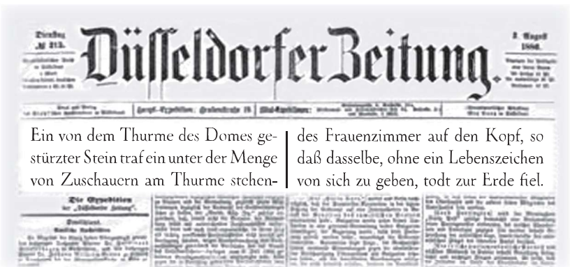
Meldung in der Düsseldorfer Zeitung am 17. August 1848